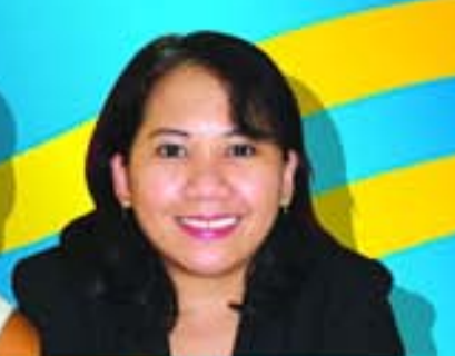
Nida Finance Executive

Digicel lo sigui duna'bo mas balor pa Bo placa den 2007